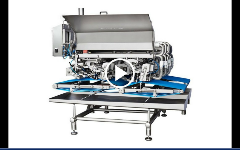
Product video Pin-Bone

Informeer hier naar de mogelijkheden voor een demonstratie met uw eigen producten in week 50 (7 t/m 11 december).*