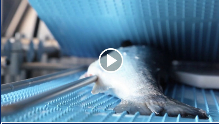
Product video Descaler